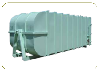
* Modelo redondo