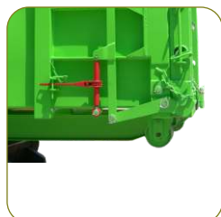
Fecho de roquete