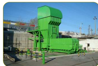
* Estação de transferência