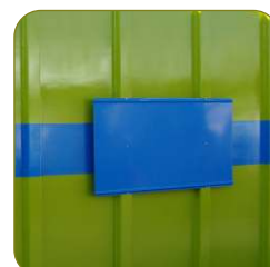
Placa para colocação de publicidade