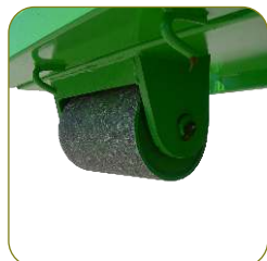
Rolete de movimentação