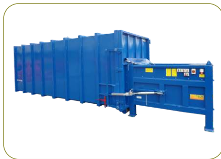
* Conjunto de contentor e compactador estático