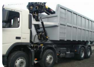
* Contentor para grua