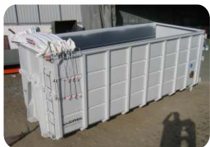
* Contentor aberto com cobertura retráctil em encerado