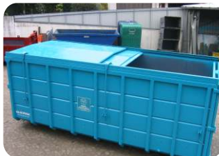
* Contentor aberto com duas tampas metálicas deslizantes