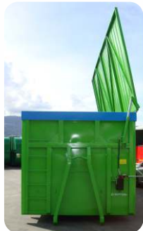
* Contentor aberto com tampa de abertura hidráulica