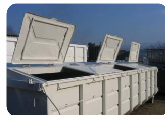
* Contentor aberto com tampas metálicas fixas e abertura superior