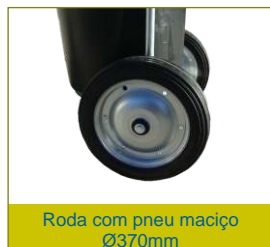
Roda com pneu maciço Ø370mm