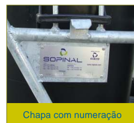
Chapa com numeração