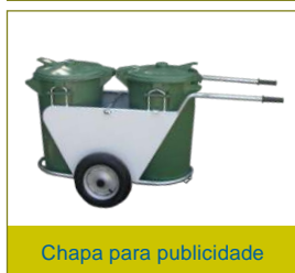
Chapa para publicidade