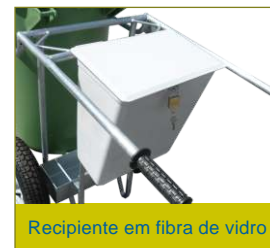
Recipiente em fibra de vidro